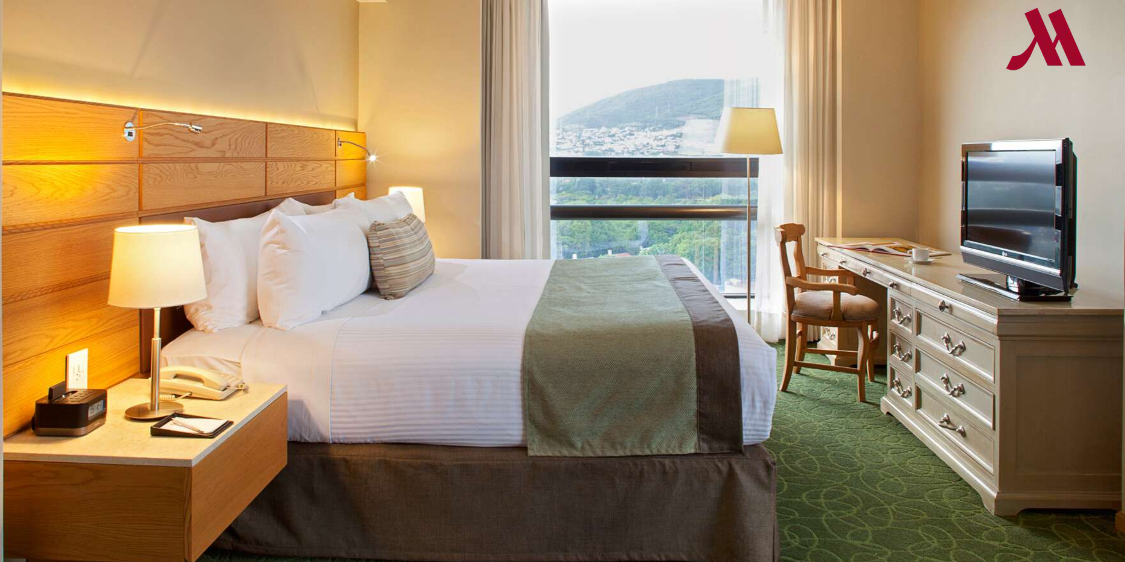
SUITE GOBERNADOR (PISO EJECUTIVO)